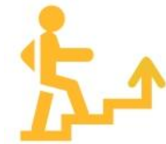
Логотип трека «Орлёнок – Лидер»

Ценности, значимые качества трека: дружба, команда